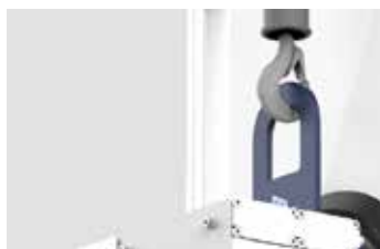
Mit demontierbarer, vertikaler Kranöse