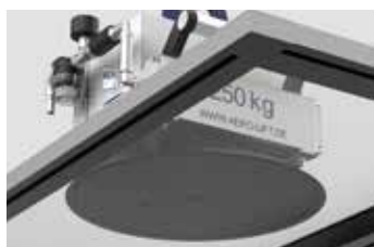
Individuell anpassbar durch auswechselbare Saugplatten