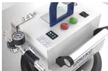
Intelligente Warneinrichtung inkl. LED Leuchten